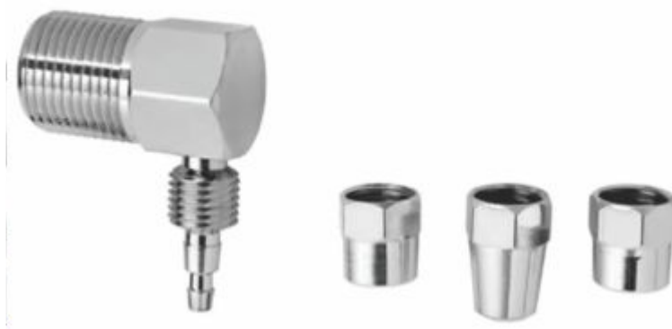
Adaptador Espigão Lateral Parede 3x1