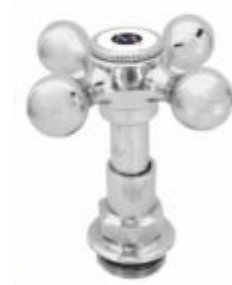
Reparo p/ Torneira Cabeçote C-33 Cromado