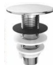
Plug tapa furo Cromado p/ Pia