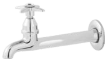
1158 Torneira Fixa Cozinha Parede 18cm Comum