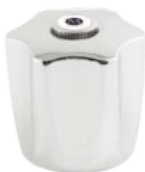
Volante C-50 Metal / ABS