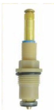
Reparo p/ Registro 1416