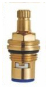
Reparo p/ Torneira 1/4 de Volta Direito Azul - M22