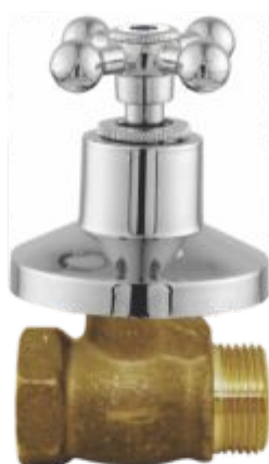
1416 Registro de Pressão 3/4