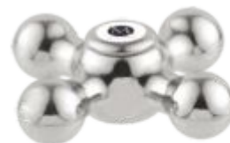
Cruzeta C-33 Metal / ABS