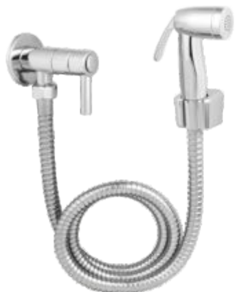
Kit Ducha Higiênica Metal Gatilho ABS Cromado