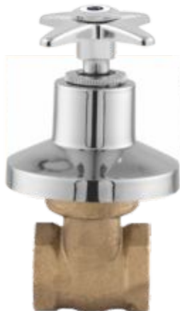
1509 Registro de Gaveta 1/2