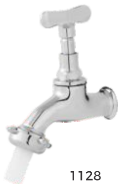
1128 Torneira Jardim Curta Parede - 1/2 ou 3/4 ou Cromada