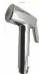
Gatilho p/ Ducha Higiênica ABS s/ suporte Cr.