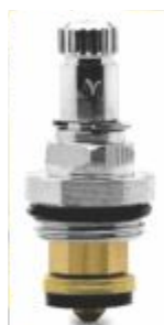
Reparo p/ Torneira Parado Cromado