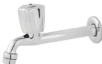
1158 Torneira Fixa Cozinha Parede 18cm c/ Arejador