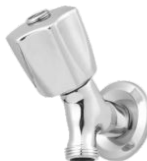
Registro p/ Máquina de Lavar Parede