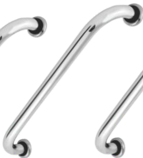
Barra de Apoio 30cm