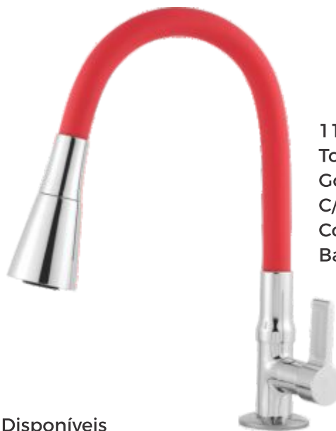
1169 Torneira Gourmet Color C/ Jato Duplo Cone Bancada