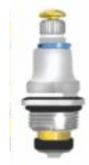
Reparo p/ Torneira MVI Pequeno M.18 Metal Cr.