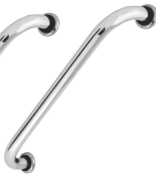
Barra de Apoio 50cm