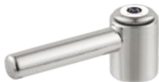
Alavanca C-34 Metal / ABS