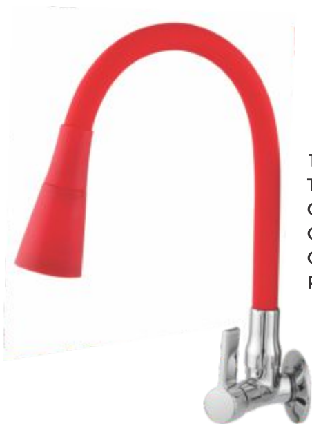
1168 Torneira Gourmet Color C/ Jato Duplo Cone Parede