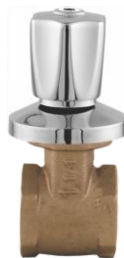
1509 Registro de Gaveta 1"1/4