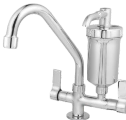
1185 Purificador ABS Bica Móvel Bancada