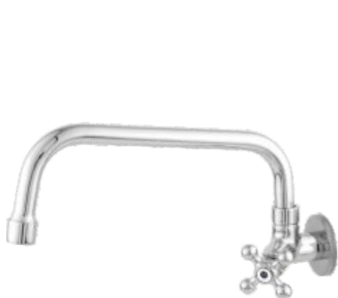
1167 Torneira Bica Móvel Reta Parede