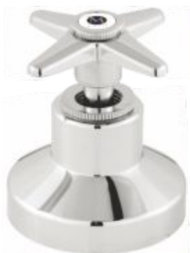
Acabamento p/ Registro C-23 3/4 ou 1"1/2