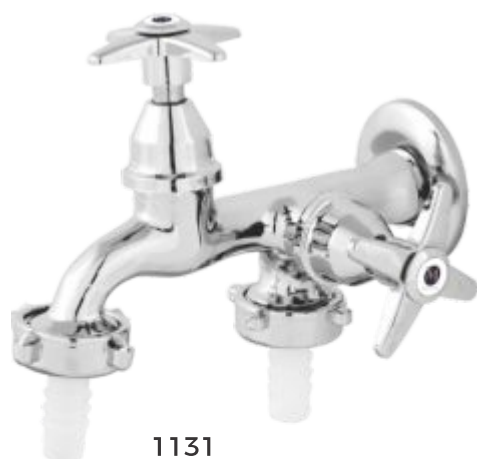
1131 Torneira p/ Máquina de Lavar Parede