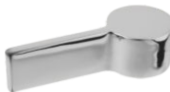
Alavanca C-90 Metal / ABS