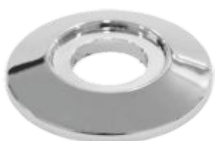
Canopla Cromada p/ Torneira parede com Rebaixo