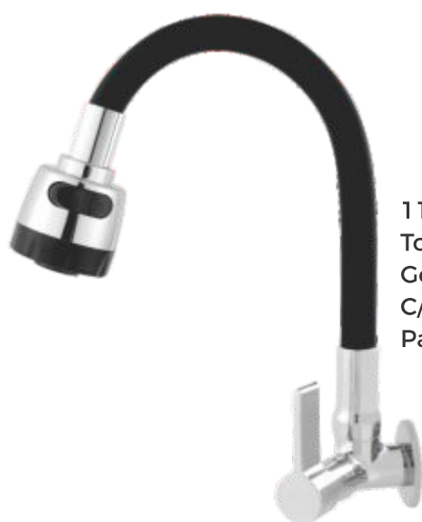
1168 Torneira Gourmet Color C/ Jato Duplo Parede