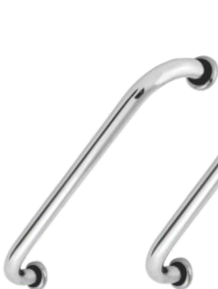
Barra de Apoio 25cm