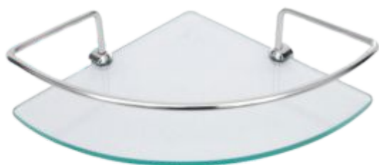
Porta Shampoo de Canto