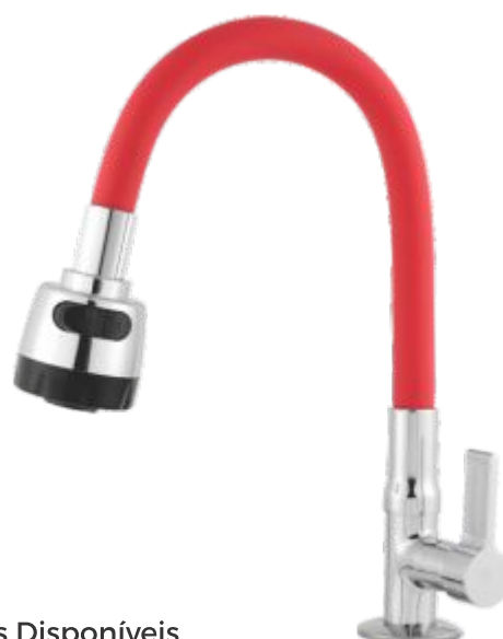
1169 Torneira Gourmet Color C/ Jato Duplo Bancada