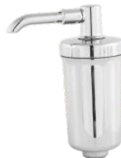
Copo Filtro Purificador ABS Cr. c/ Vela Pró-Saúde