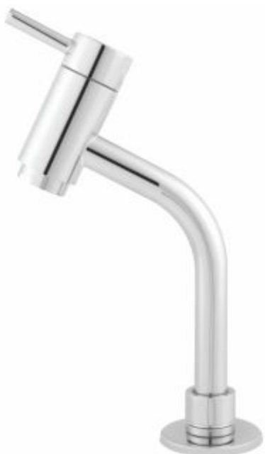
Torneira Link Redonda 45° Baixa Angular Bancada