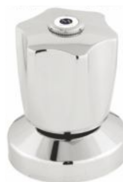
Acabamento p/ Registro C-50 3/4 ou 1"1/2