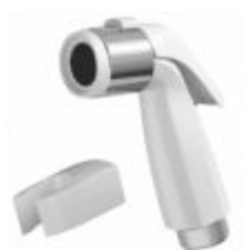
Gatilho p/ Ducha Higiênica ABS c/ suporte Br./Cr.