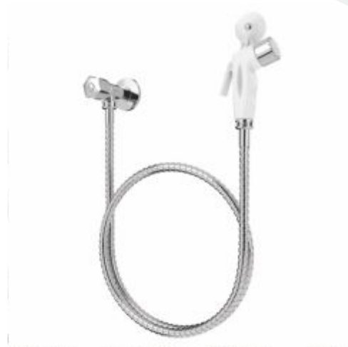
Kit Ducha Higiênica Cr. Gatilho Branco ABS Plus Importada