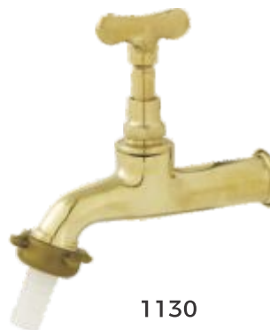
1130 Torneira Jardim Longa Parede - 1/2 ou 3/4 Amarela