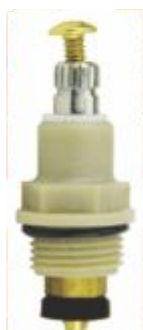
Reparo p/ Torneira Bognar