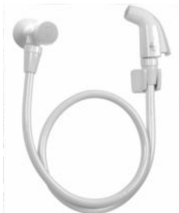
Kit Ducha Higiênica ABS Pop Branca - Importada