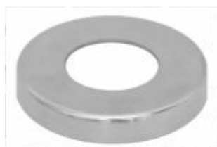
Canopla Cromada Slim p/ Torneira Lavatório