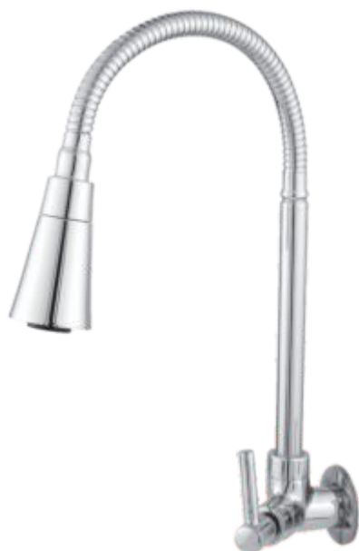
1168 Torneira Gourmet C/ Jato Duplo Cone Cr. Parede