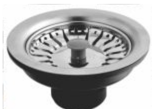
Válvula p/ Pia Americana ABS c/ INOX 3"1/2