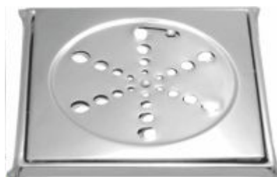
Grelha Quadrada Inox Com Caixilho 15x15