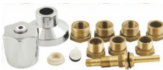
Reparo Salva Registro 7 peças - Rosca "0" c/ buchas C-23 / C-25 / C-33 / C-50