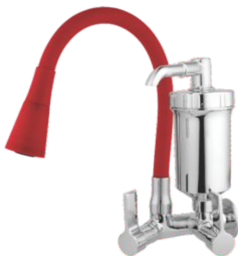
2186 Purificador ABS Gourmet Color C/ Jato Duplo Cone Parede