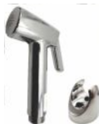
Gatilho p/ Ducha Higiênica ABS c/ suporte Plus Cr.