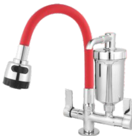
1185 Purificador ABS Gourmet Color C/ Jato Duplo Bancada