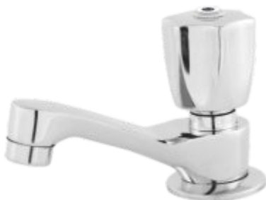
1194 Torneira Lavatório Bancada