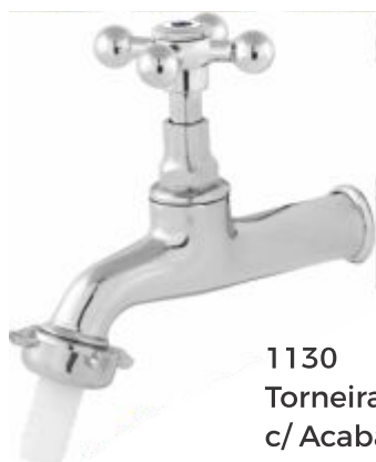
1130 Torneira Jardim c/ Acabamento Parede - 1/2 ou 3/4