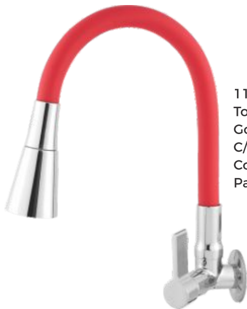
1168 Torneira Gourmet Color C/ Jato Duplo Cone Parede