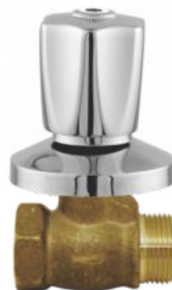
1416 Light Registro de Pressão 1/2 ou 3/4