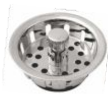
Cestinha ABS Cromada p/ Válvula Americana 3"1/2 e 4"1/2