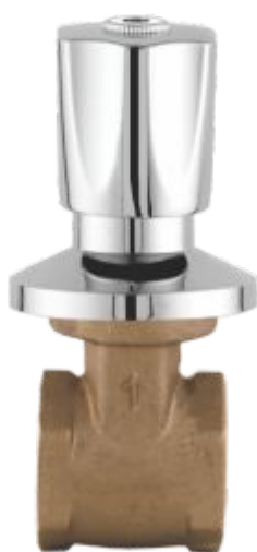
1509 Registro de Gaveta 1"