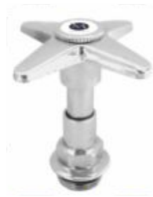
Reparo p/ Torneira Cabeçote C-23 Cromado