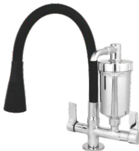
1185 Purificador ABS Gourmet Color C/ Jato Duplo Cone Bancada