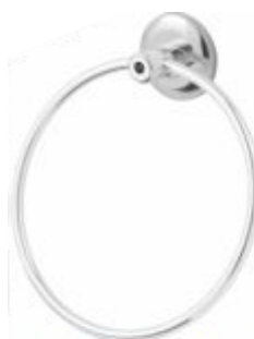
Porta Toalha Argola (Rosto)