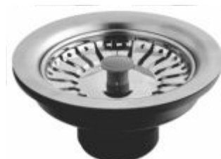
Válvula p/ Pia Americana INOX 4"1/2