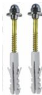
Parafuso de Fixação Latão com Bucha p/ Vaso Sanitário B08 - B10 - B12