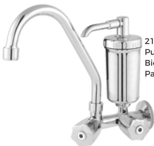
2186 Purificador ABS Bica Móvel Parede