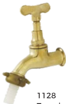
1128 Torneira Jardim Curta Parede - 1/2 ou 3/4 Amarela