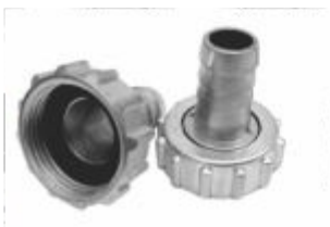
Bico União p/ Mangueira Zamak Cromado 1/2 ou 3/4x1/2