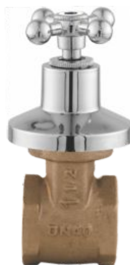
1509 Registro de Gaveta 1"1/2