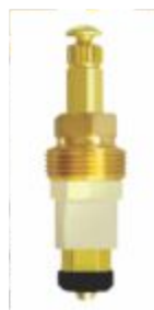
Reparo p/ Torneira MVS Pequeno Universal