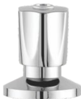
Acabamento p/ Registro C-25 3/4 ou 1"1/2