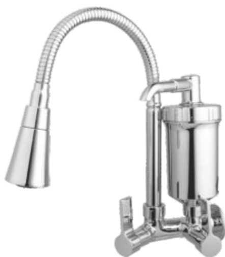
2186 Purificador ABS Gourmet Cr. C/ Jato Duplo Cone Parede