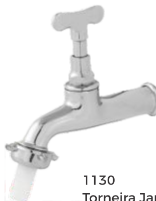
1130 Torneira Jardim Longa Parede - 1/2 ou 3/4 Cromada