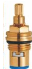
Reparo p/ Torneira 1/4 de Volta Direito Azul - M22