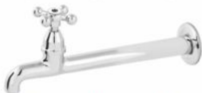
1159 Torneira Fixa Cozinha Parede 22cm Comum