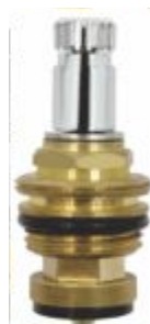
Reparo p/ Torneira MVS Dupla Rosca Eixo Cromado