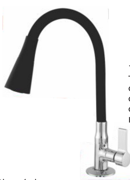
1169 Torneira Gourmet Color C/ Jato Duplo Cone Bancada