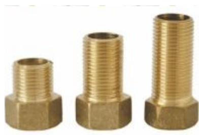
Aumento de latão 1/2 CURTO / MÉDIO / LONGO