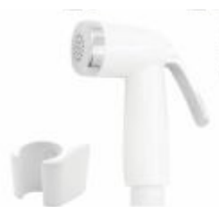
Gatilho p/ Ducha Higiênica ABS c/ suporte Branca