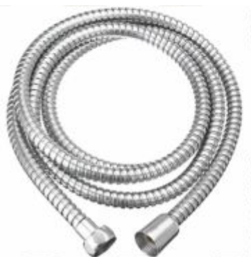
Engate Flexível Corrugado Porca Abs Cromado 1,20m, 1,50m e 2m