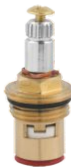
Reparo p/ Torneira M18 Pistão Cromado 1/4 de Volta Esquerdo Vermelho