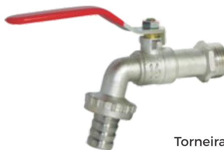
Torneira Jardim Esfera 1/2 x 3/4