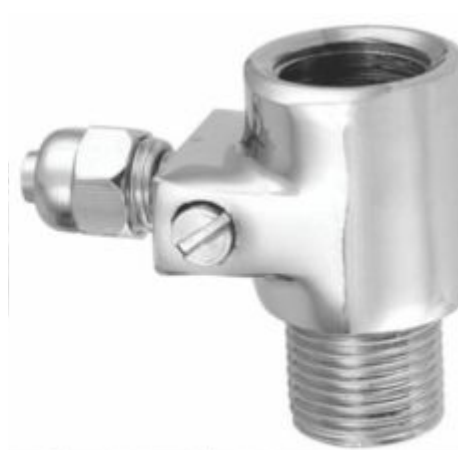
Adaptador para Filtro T Com Registro 1/4 - A29A 3/8 - A29C 5/16 - A29B