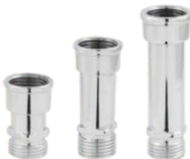
Aumento Cromado 1/2 CURTO / MÉDIO / LONGO