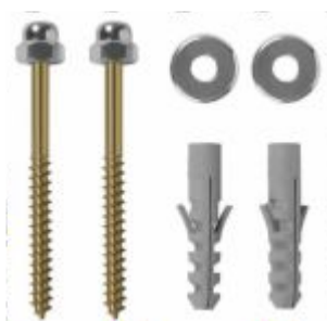
Parafuso de Fixação Latonado com Bucha p/ Vaso Sanitário B08 - B10 - B12