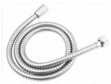
Engate Flexível Corrugado Porca Latão Cromado 1,20m, 1,50m e 2m