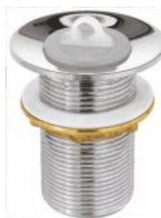
Válvula p/ Pia Tanque Cr. Metal 1"1/4