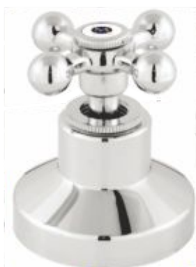
Acabamento p/ Registro C-33 3/4 ou 1"1/2