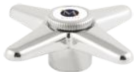
Cruzeta C-23 Metal / ABS