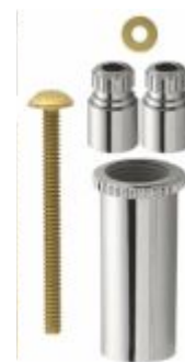
Kit Prolongador de Registro 1/2 e 3/4 x 1"