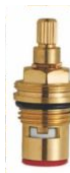
Reparo p/ Torneira 1/4 de Volta Esquerdo Vermelho - M22