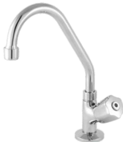
1169 Torneira Bica Móvel Bancada