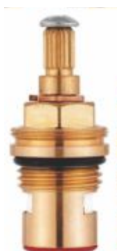
Reparo p/ Torneira 1/4 de Volta Esquerdo Vermelho - M22