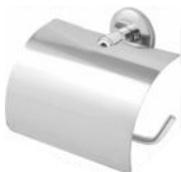
Papeleira c/ Tampa