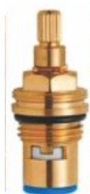
Reparo p/ Torneira 1/4 de Volta Direito Azul - M22