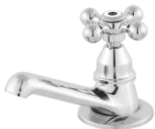
1193 Torneira Lavatório Bancada