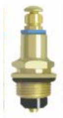
Reparo p/ Torneira MVI Pequeno M.18 Metal