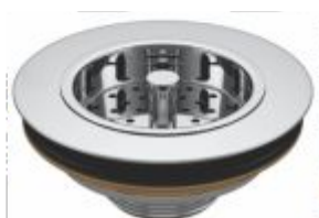
Válvula p/ Pia Americana Cr. Metal 3"1/2 Embalagens c/: 1 peça / 20 peças ou 50 peças