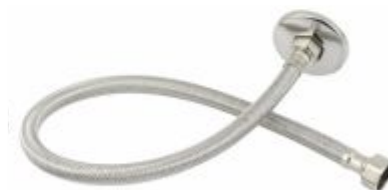
Engate Trançado Malha de aço 30cm, 40cm e 60cm