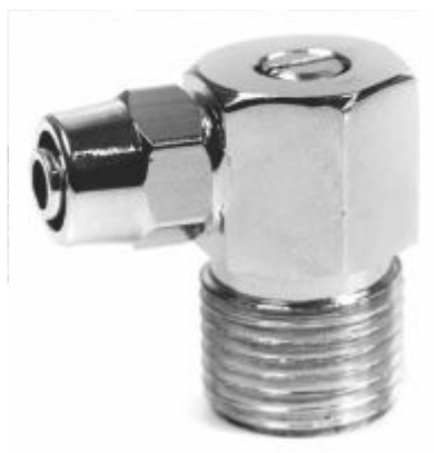
Adaptador Ponta de Saída Com Registro 1/4 - A34A 3/8 - A34C 5/16 - A34B