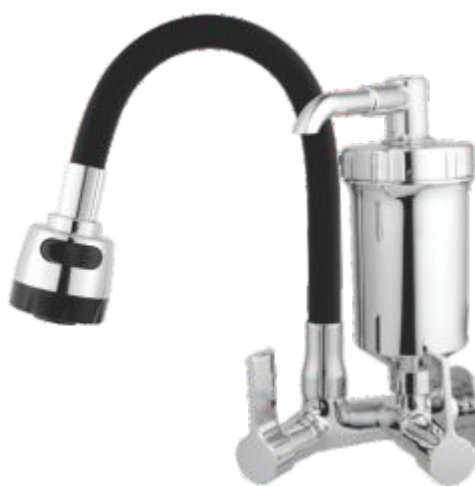
2186 Purificador ABS Gourmet Color C/ Jato Duplo Parede