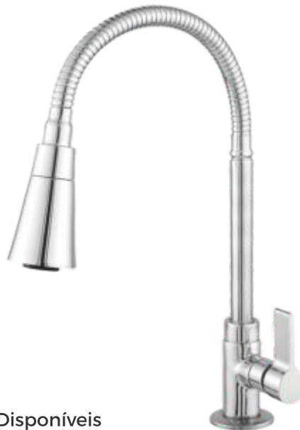
1169 Torneira Gourmet C/ Jato Duplo Cone Cr. Bancada