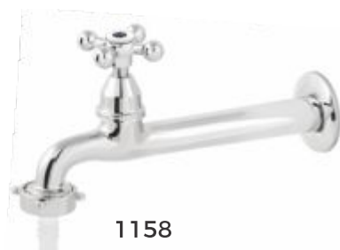
1158 Torneira Fixa Cozinha Parede 18cm c/ Bico