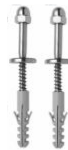
Parafuso de Fixação INOX com Bucha p/ Vaso Sanitário B08 - B10 - B12