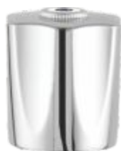
Volante C-25 Metal / ABS