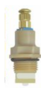
Reparo p/ Torneira MVS Ativi Filtro Amarelo