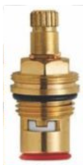
Reparo p/ Torneira 1/4 de Volta Esquerdo Vermelho - M22