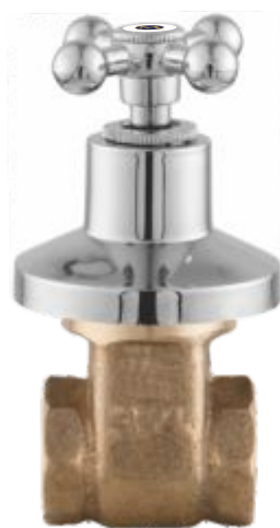
1509 Registro de Gaveta 3/4