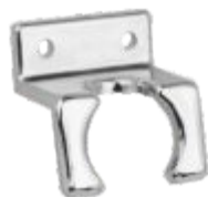
Suporte Simples p/ Ducha Higiênica ABS Cromado