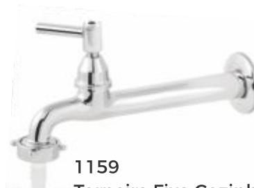
1159 Torneira Fixa Cozinha Parede 22cm c/ Bico