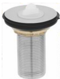
Válvula p/ Pia Lavatório Cr. Metal 7/8 Embalagens c/: 1 peça / 20 peças ou 50 peças