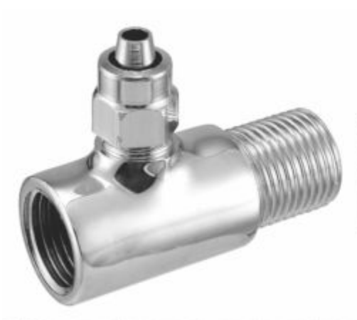
Adaptador para Filtro T 1/2 p/ Mangueira 1/4