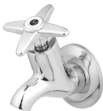
1125 Torneira para Bebedouro Metal