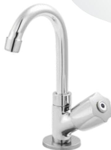
1195 Torneira Bica Móvel Lavatório Bancada