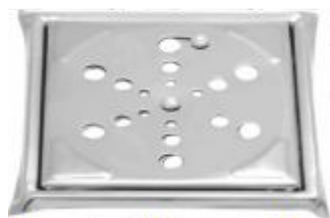
Grelha Quadrada Inox Com Caixilho 10x10