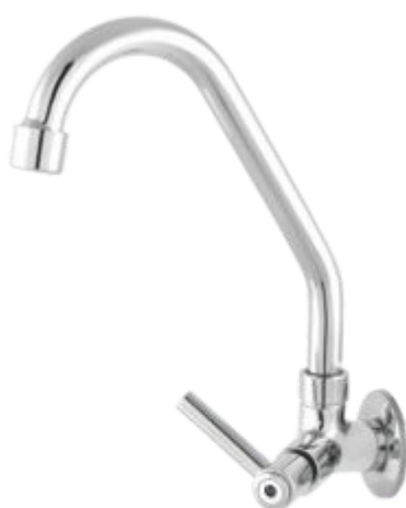
1168 Torneira Bica Móvel Parede