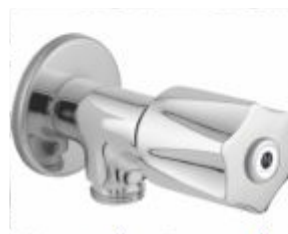
Registro para Ducha Higiênica