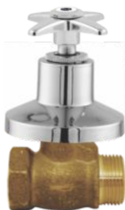
1416 Registro de Pressão 1/2