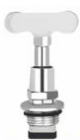
Reparo p/ Torneira Cabeçote Chaveta Cromada M.18