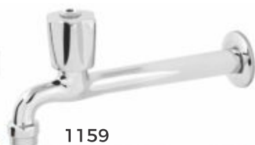
1159 Torneira Fixa Cozinha Parede 22cm c/ Arejador