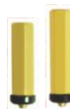
Reparo p/ Torneira Tucho 23mm 7/16 Tucho 26mm 7/16