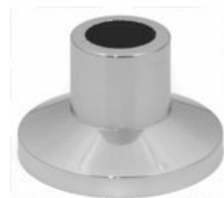
Canopla ABS p/ Registro com prensa canopla 3/4 ou 1"1/2