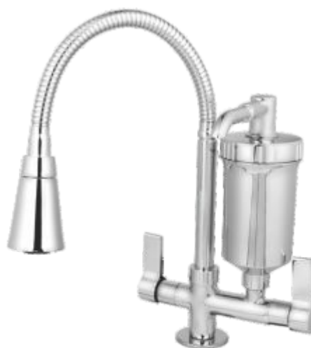
1185 Purificador ABS Gourmet Cr. C/ Jato Duplo Cone Bancada